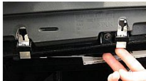
Funktionsweise der Blechklammern

Entriegeln Sie die beiden Blechklammern bei geöffnetem Handschuhfach, indem Sie sie mit einem Haken herunterziehen. Anschließend kann die Blende mit den Lüftungsauslässen abgezogen werden.